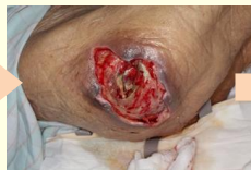
②デブリードマン後