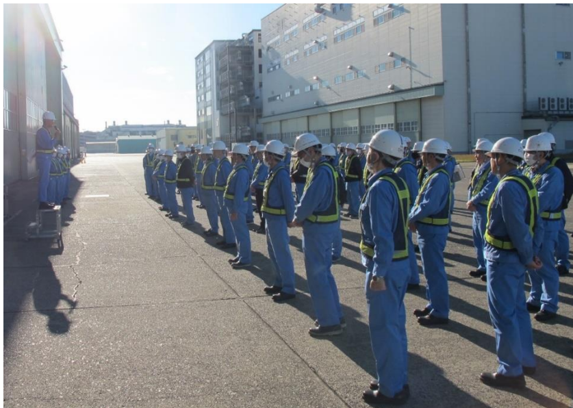
10月 社長訓示の様子