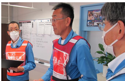
航空事故処理訓練の様子

12月には、当社敷地に爆発物が仕掛けられたとの想定で、犯人からの爆破予告電話への対応訓練を実施するなど、有事における対応力の向上を図ると共に更なる体制強化に向けた改善事項の抽出を行いました。