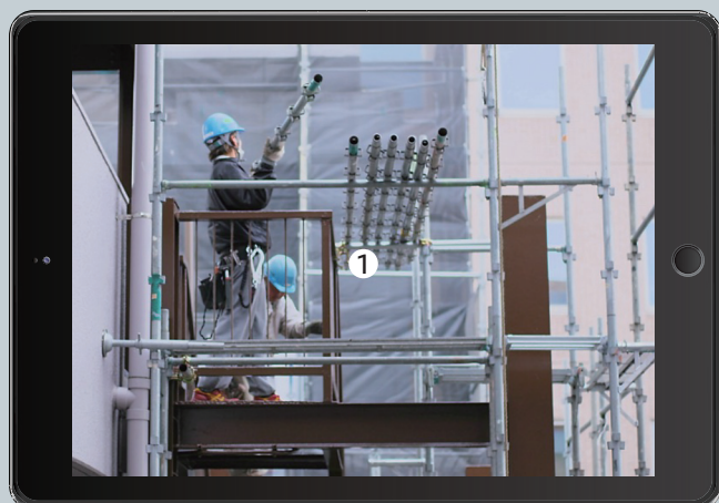
① コンテンツ（リスクが内在されている写真）が配信される

コンテンツをパソコンやスマホ、タブレットに配信。 ほんの数分で定期的に「リスク発見の癖つけ」と「観る力」をつけることが出来、 安全に作業を進める力が向上します。