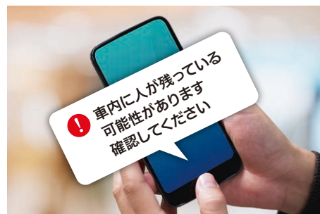
登録番号へ通知 (オプション)