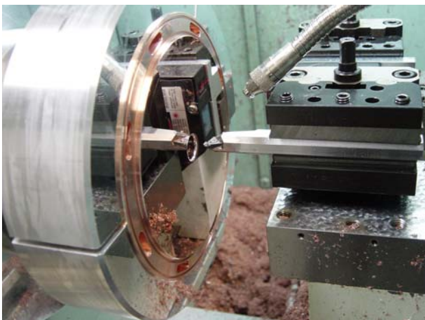
図2：Cバンド加速管超精密加工

Cバンドチョークモード型加速管 [1], [2], [3] の材料は、日立電線の高純度無酸素銅をHIP処理したものを用いた。材料、HIP処理を含めて、超精密加工前までの機械加工は日立電線で行っている。日立電線では、超精密加工面取り代0.03mm残し、寸法精度±0.01mmまでの機械加工を行う。その後、社内にて、加速管1本あたり91枚のセル内面は超精密旋盤で鏡面仕上げし、真空ろう付けで組み立てる。個々の空胴の周波数は超精密旋盤で修正加工して調整しているために、最も負荷が高くなる超精密加工は昼夜勤で所内3台、協力会社1台(昼勤のみ)の旋盤で行っている。