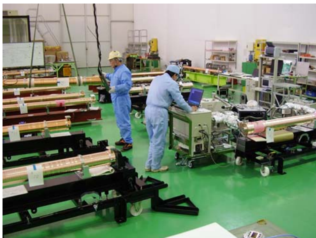
図5：ろう付後真空試験、耐圧試験、RF計測試験

ろう付した加速管はクリーンルームで真空試験、耐圧試験、RF計測を行い、内部に乾燥窒素を封入して出荷する。RF計測は、ろう付前の単体計測を含めて全部で9台のネットワークアナライザーを使用して行っている。