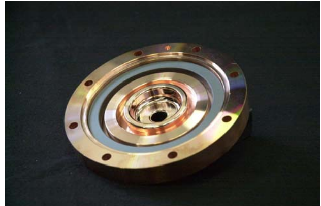
図3：SiCを圧入したCバンド加速管セル

加工完了したセルには、タングステン製のばねをセットし、イビデン製SiCをプレスで圧入する。ろう付は所内大型炉2台と小型炉1台を使用し、導波管を含めて大型炉7～8バッチ/月、小型炉4バッチ/月で処理する。